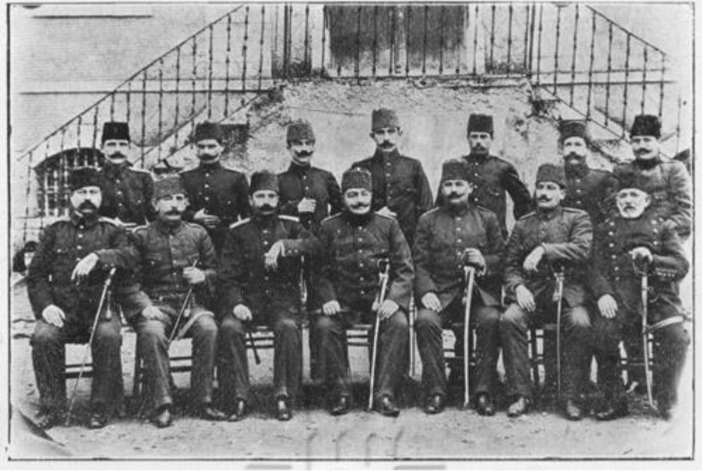
EK: 4 Dört Haftalık Redif Talimlerine Mahsus Ders Endahtı Vazifeleri 61