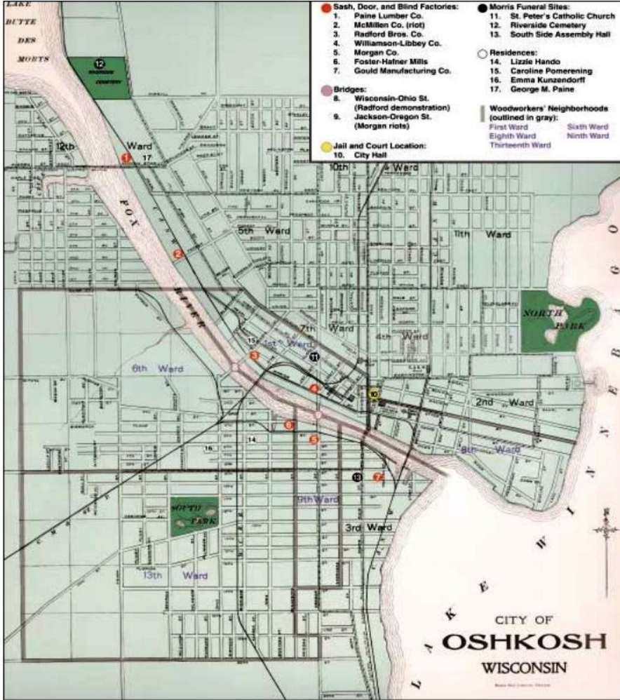
Resim-1: Oshkosh'taki kereste fabrikaları (1898)