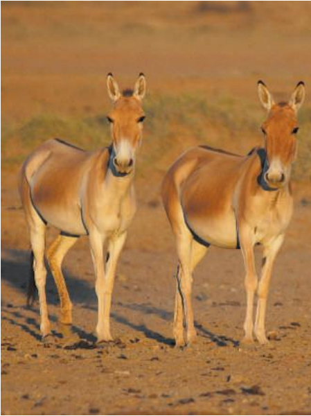
Resim 2: Gobi Asya yaban eşekleri