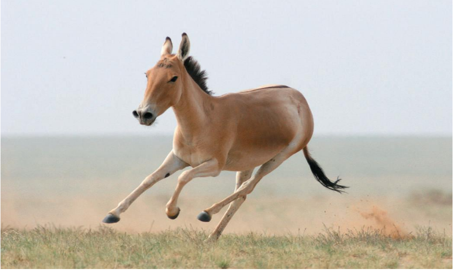
Resim 1: Gobi çölünde Asya yaban eşegi (Kaczensky ve Walzer 2008: 147).