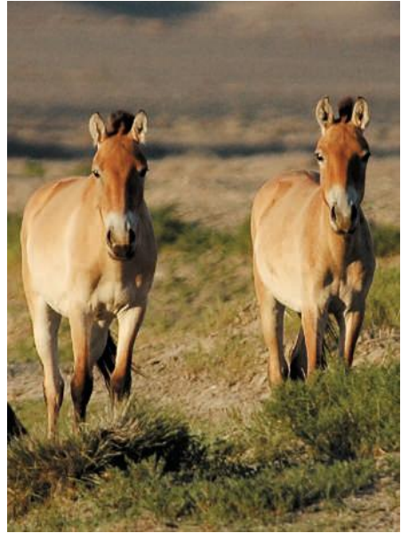
Resim 3: Gobi Asya Przewalski yaban atları (Kaczensky ve Walzer 2008: 151).