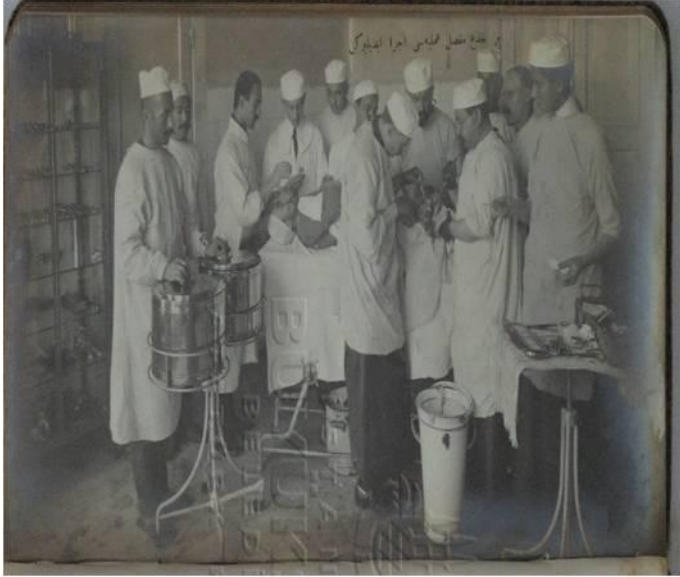
Resim 4: Ameliyathanedeki görüntüler