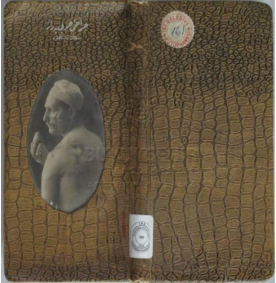
Resim1: Kitap dış kapak