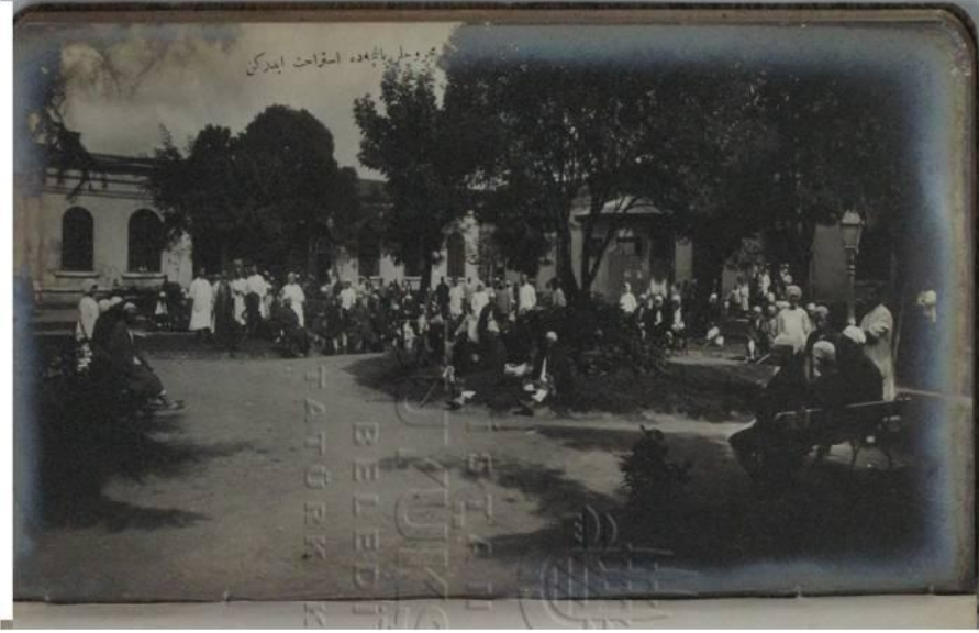
Resim 5: Hastane bahçesi ve yaralılar