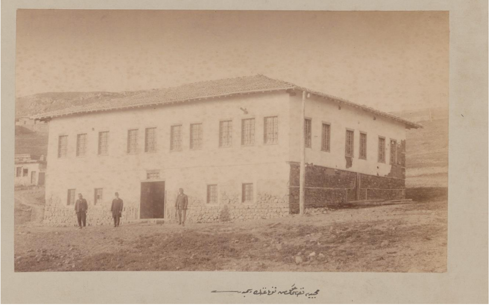
Mecidiye Kazası Hükümet Konağı: Başbakanlık Osmanlı Arşivi Fotoğraflar (FTG.f.), 1768.